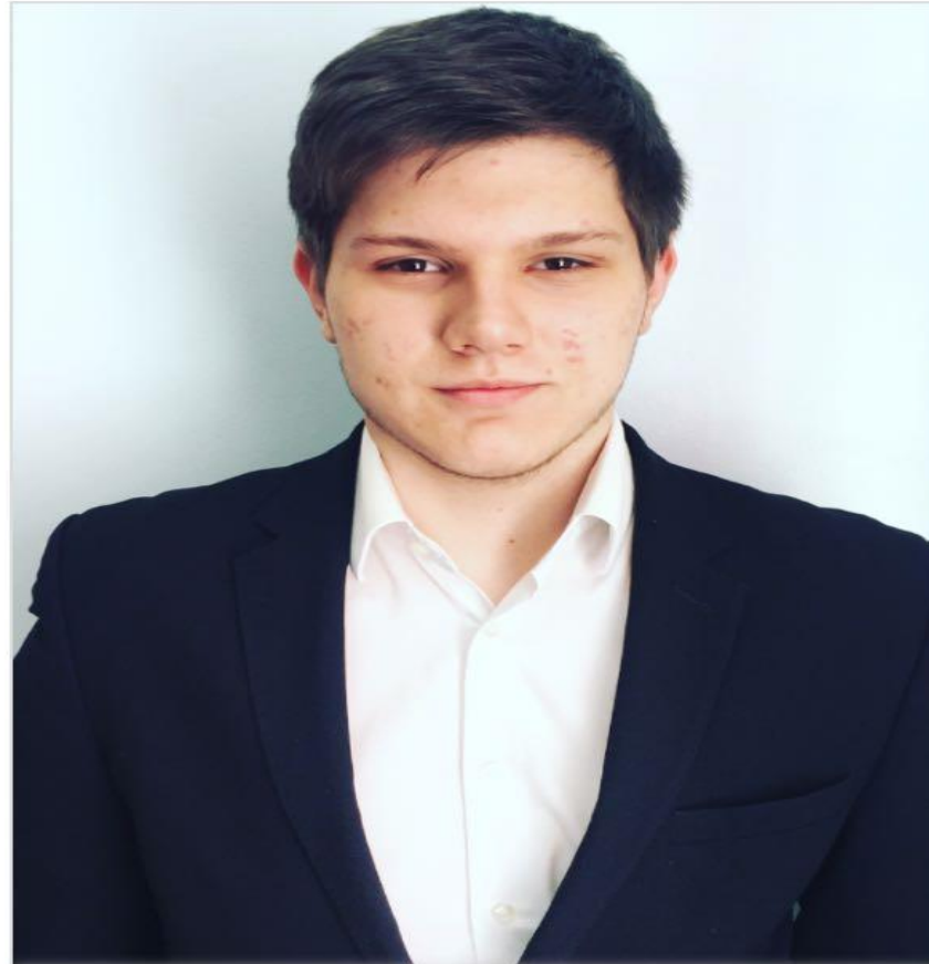
Илья Буду инженером!